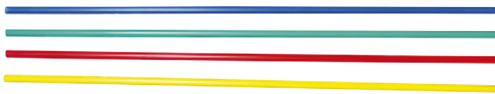
Länge 160 cm

Vielfach verwendbare Übungshilfe für Schule und Verein.