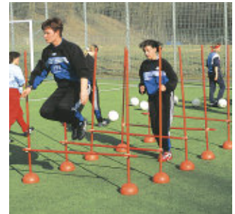
Sprung aus dem Stand