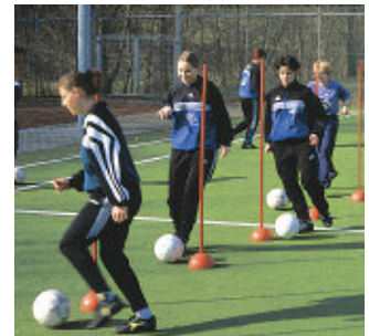
Slalomübung mit Ball