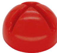
Ø 20 cm