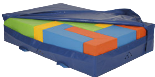
Weichbodensatz in PVC-Hülle 240 x 150 x 30 cm