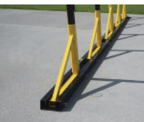
Basis der Säulenbögen