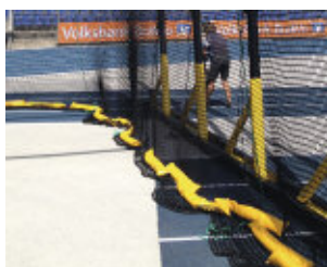
Sandsackbeschwerung des Netzes