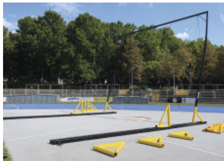
Aufbau der freistehenden Anlage