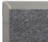
UNTERSEITE MIT ANTI-RUTSCH-KASCHIERUNG