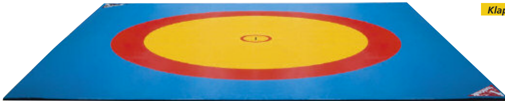
Klappkanten für faltenfreie Abdeckung