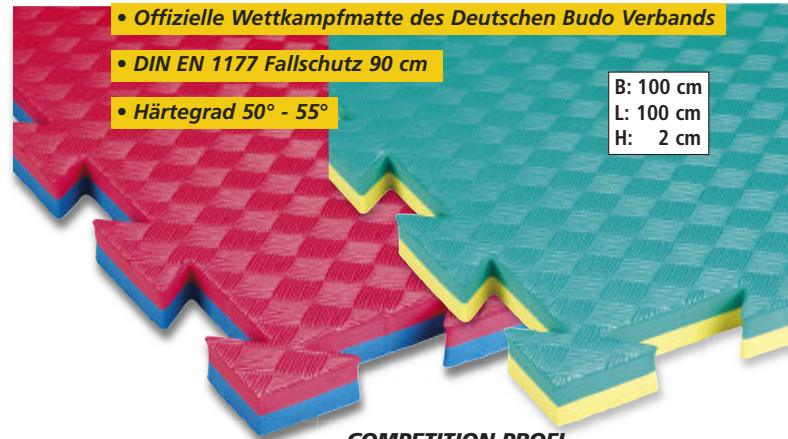
• Offizielle Wettkampfmatte des Deutschen Budo Verbands