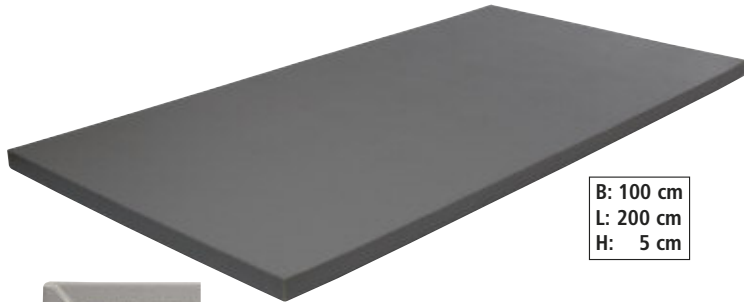
B: 100 cm L: 200 cm H: 5 cm