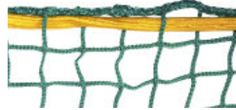
Maschenweite 45 mm